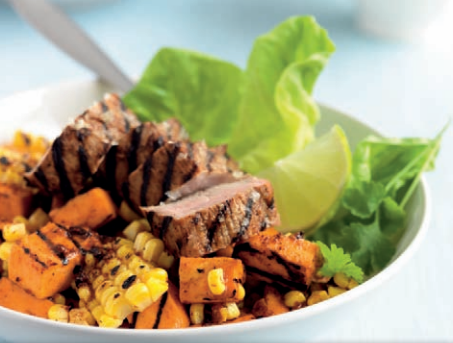
cacao & pumpkin salad with grilled pork fillet