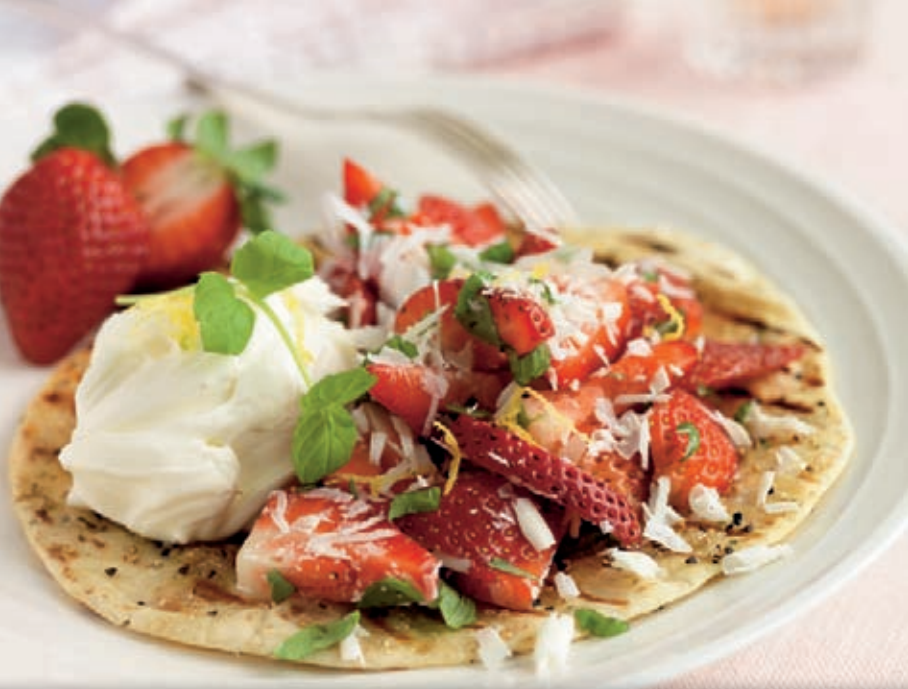
strawberry pepper tortilla