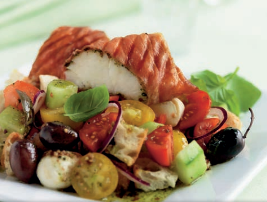
parma fish with panzanella